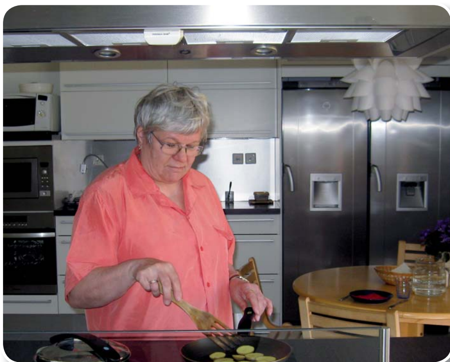
Spisens säkerhetsprodukter förbättrar säkerheten vid användningen av spisen i alla typer av hushåll.

De testade produkterna förebygger farosituationer och spisbränder genom att bryta ström till spisen utifrån tid, tid och spislattans effekt, temperatur, temperaturförändringar och rörelsesensorer eller rökutveckling. Om brytningen av strömmen baserar sig på tid samt tid och effekt, varierar de tider strömmen bryts efter mellan 5 min–5 h, beroende på spistyp